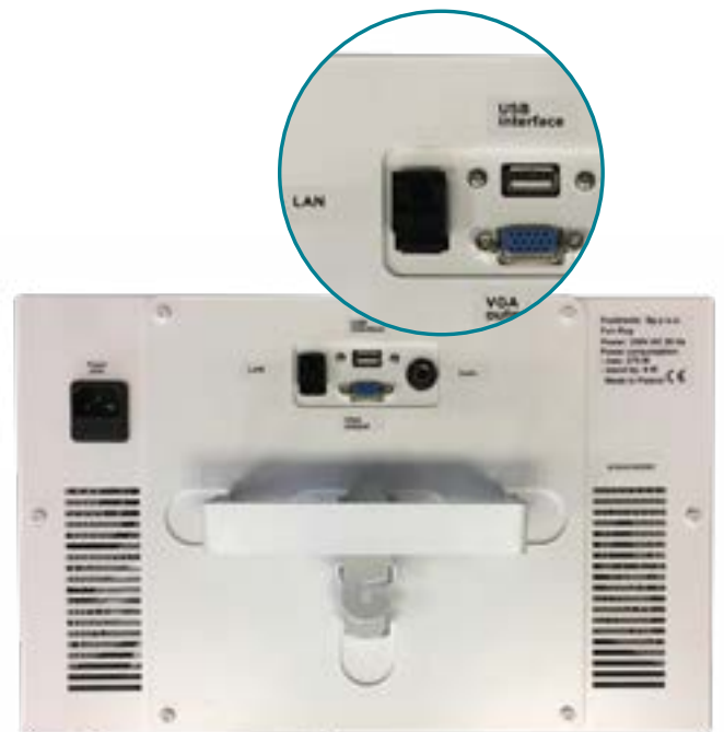
Bovenzijde van de Tovertafel

Om updates te kunnen uitvoeren, moet de Tovertafel zijn verbonden met het internet. Je kunt de Tovertafel op twee manieren op het internet aansluiten: door de wifi-dongle te gebruiken of door een internetkabel in het apparaat te steken.